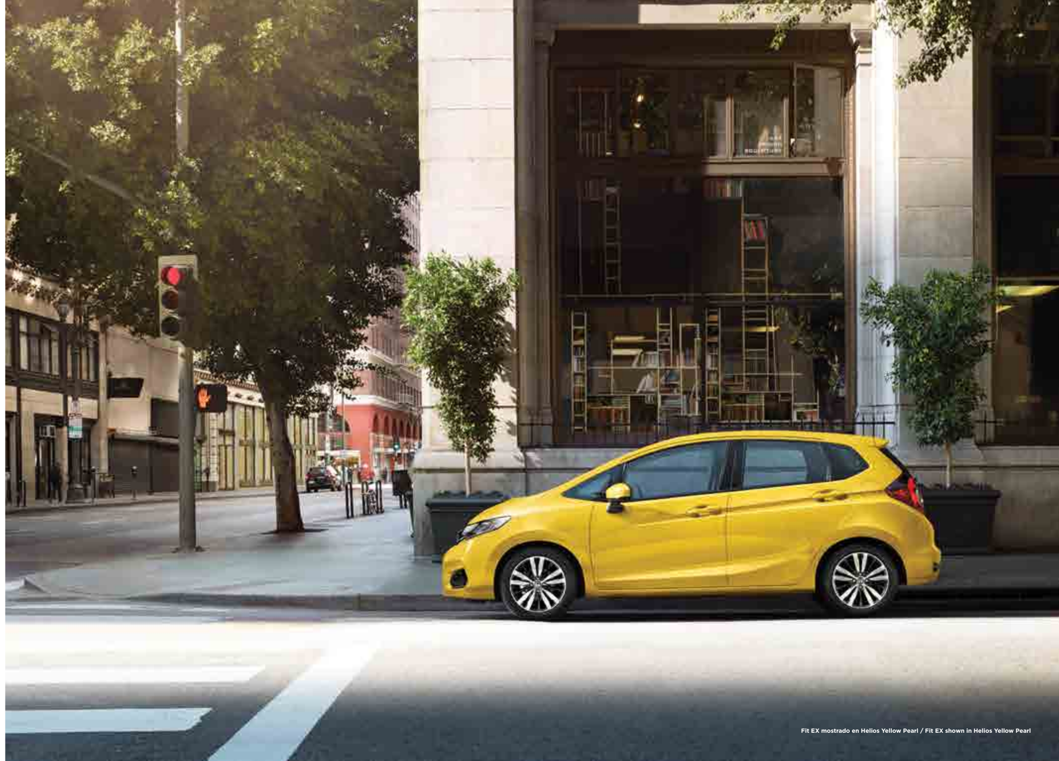
Fit EX mostrado en Helios Yellow Pearl / Fit EX shown in Helios Yellow Pearl