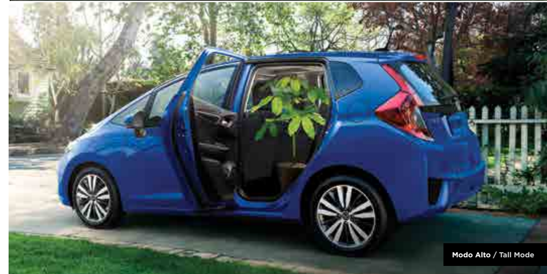
Modo Alto / Tall Mode

* Solamente usa el modo Relajación cuando el vehículo esté estacionado de una manera segura. Retorna el asiento y los apoyacabezas a su posición original antes de manejar. Honda te recuerda que asegures los artículos que cargas de una forma apropiada. / Only use Refresh mode when the vehicle is safely parked. Return the seat and head restraint to their original position before driving. Honda reminds you to properly secure items stored in the cargo area.