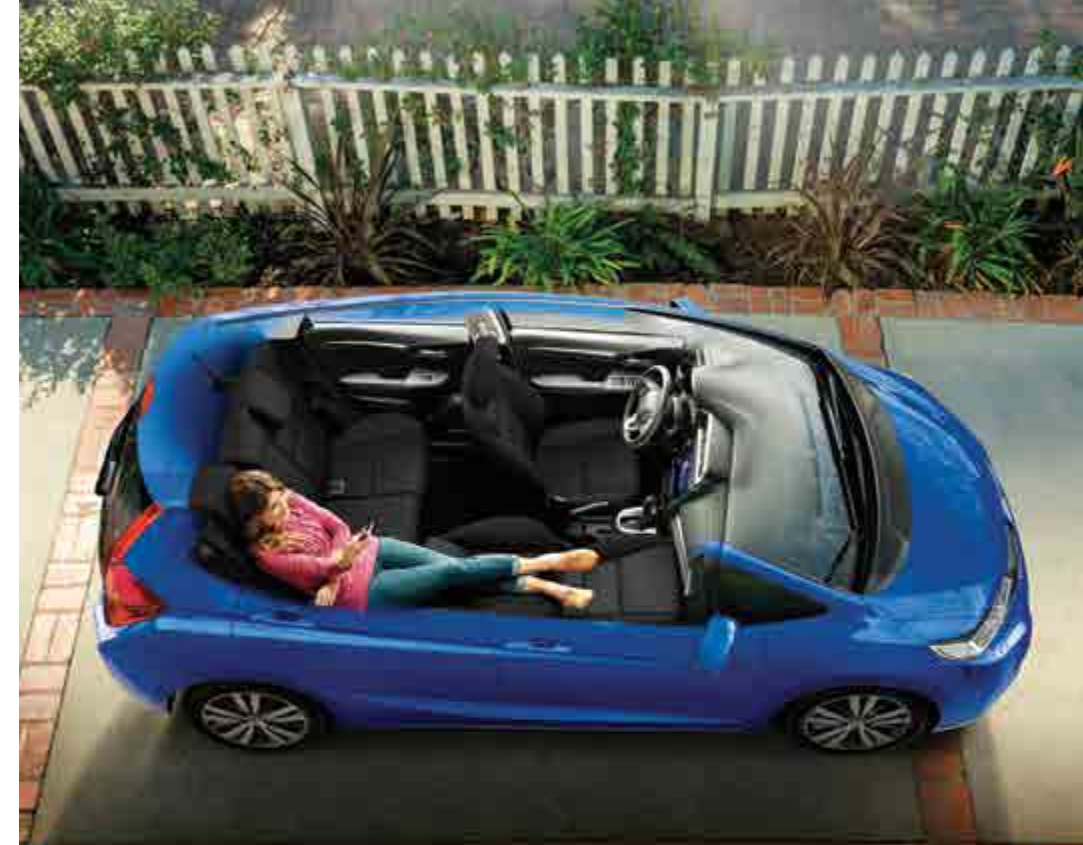
Modo Relajación / Refresh Mode

Sometimes you need a little extra cargo height. Folding up the Magic Seat gives you nearly 1.2 meters of room, top to bottom.