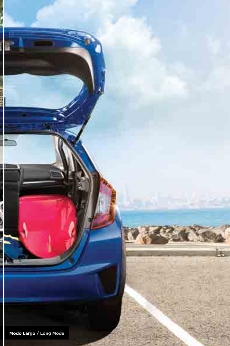
Modo Largo / Long Mode