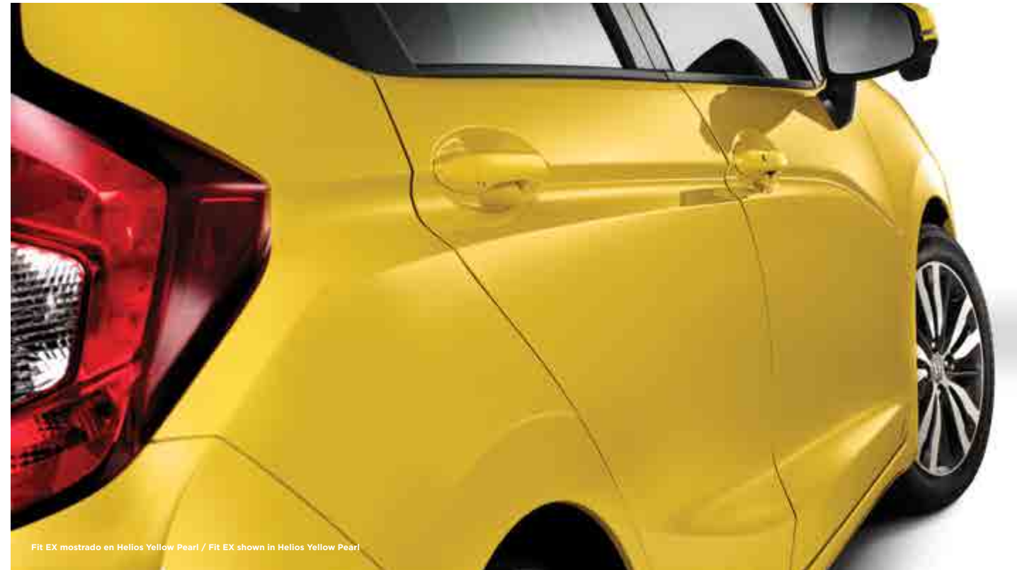
Fit EX mostrado en Helios Yellow Pearl / Fit EX shown in Helios Yellow Pearl