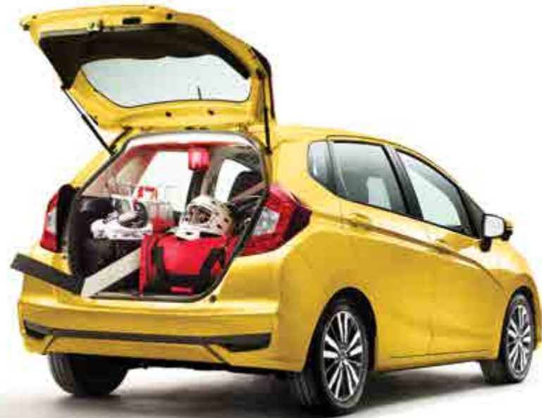
Fit EX mostrado en Helios Yellow Pearl / Fit EX shown in Helios Yellow Pearl

Small in size and big in attitude, the redesigned Fit is the right mix of modern sport styling and aerodynamic efficiency.