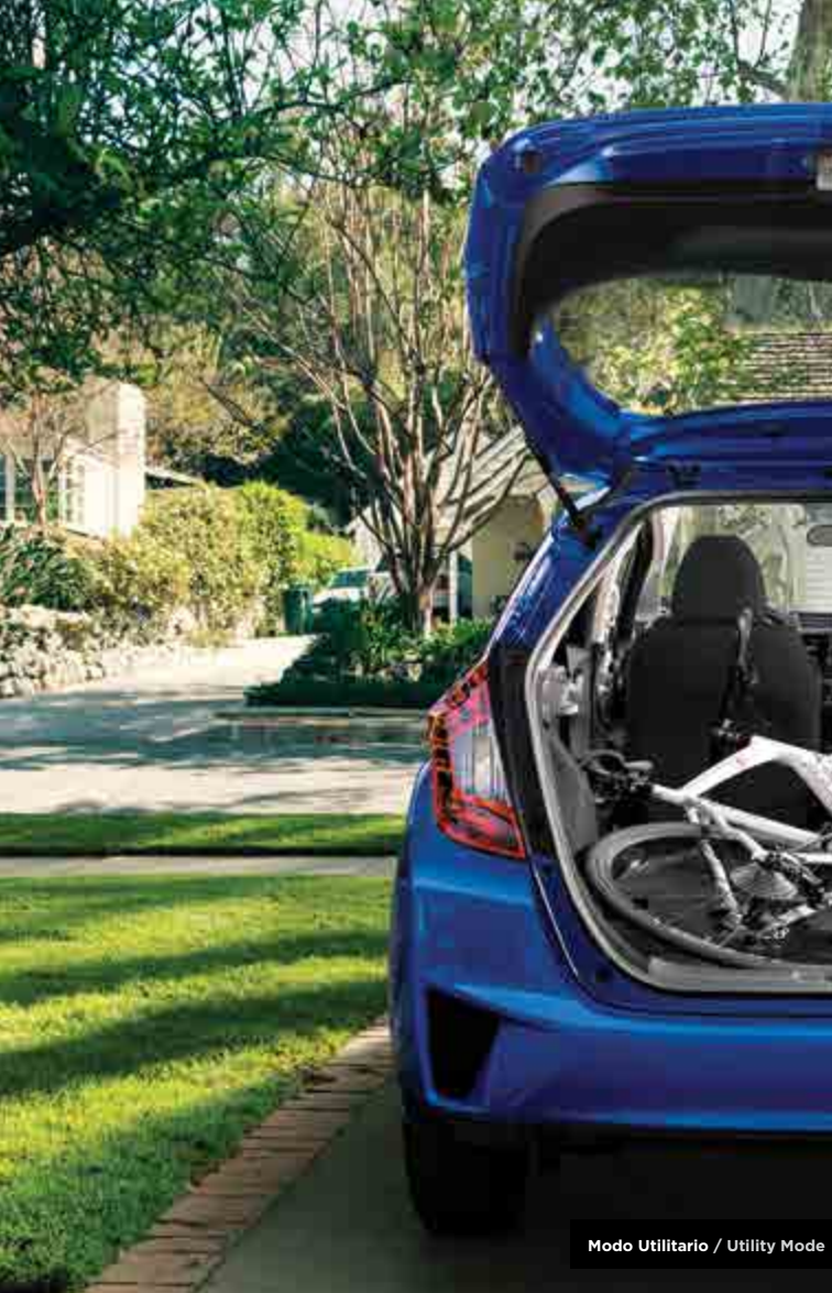
Modo Utilitario / Utility Mode