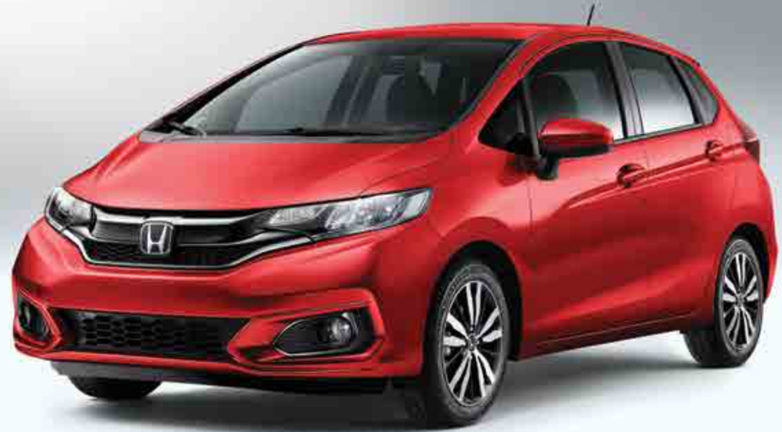
Fit EX mostrado en Milano Red / Fit EX shown in Milano Red