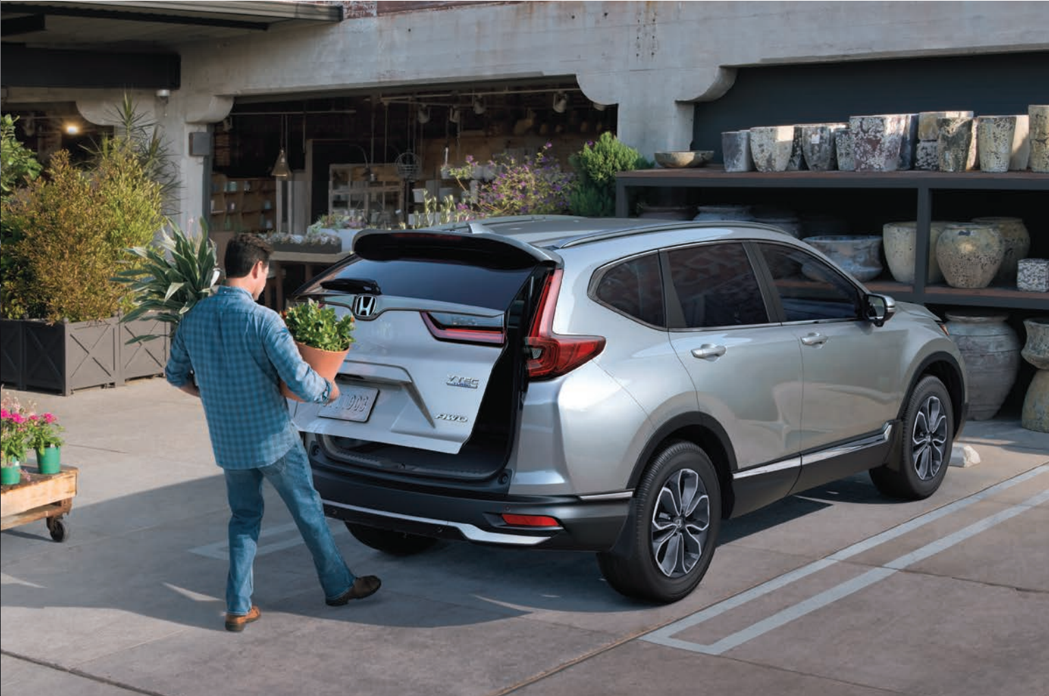
CR-V mostrada en: Lunar Silver Metálico | CR-V shown in: Lunar Silver Metálico

Descubre comodidad y estilo en una cabina que le presta atención a cada detalle. Desde los asientos delanteros diseñados para mayor comodidad, hasta más espacio trasero que otras camionetas más grandes. Tú y tus pasajeros se sentirán cómodos desde el punto de partida hasta el punto de llegada. Discover comfort and style in a cabin boasting attention to every detail. From front seats designed for greater comfort to more rear legroom than even many larger SUVs, you and your passengers are comfortable from Point A to B.