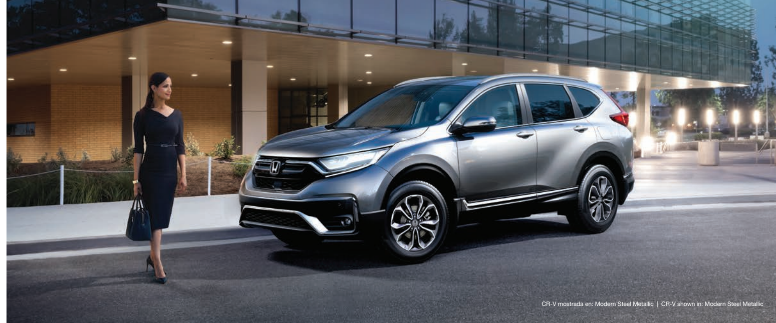
CR-V mostrada en: Modern Steel Metallic | CR-V shown in: Modern Steel Metallic

The vehicle that defined a category now redefines what a compact sport-utility vehicle can be. Introducing the redesigned Honda CR-V: delivering a wealth of standard features and driver and passenger conveniences. Welcome to the style, elegance and versatility of the Honda CR-V.