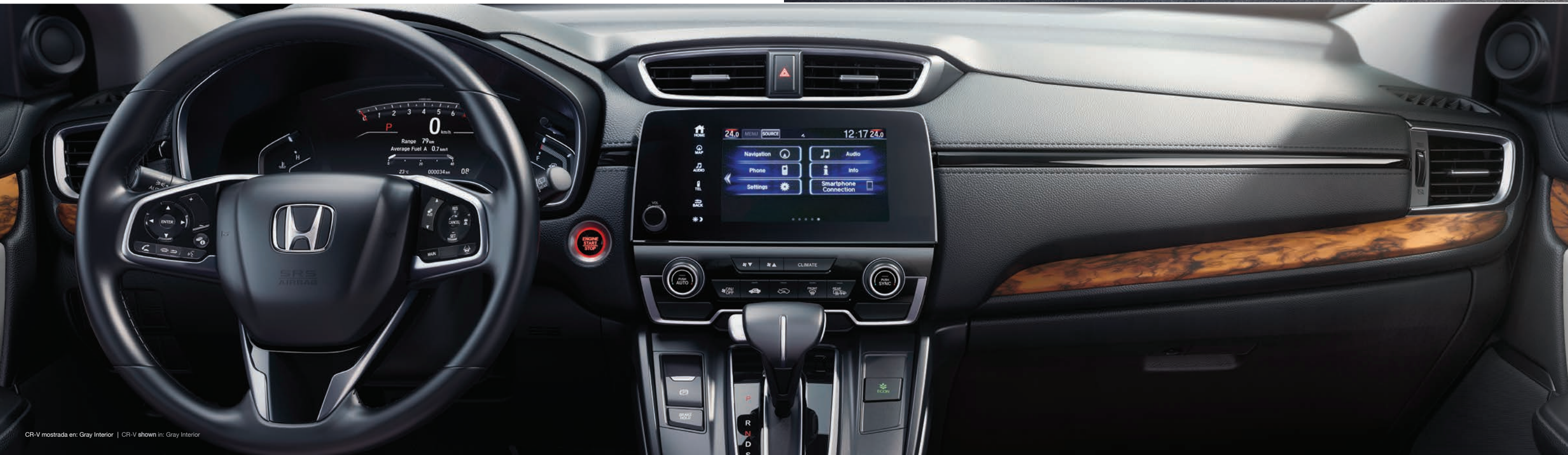
CR-V mostrada en: Gray Interior | CR-V shown in: Gray Interior