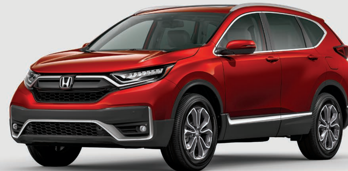
CR-V mostrada en: Molten Lava Red Pearl | CR-V shown in: Molten Lava Red Pearl