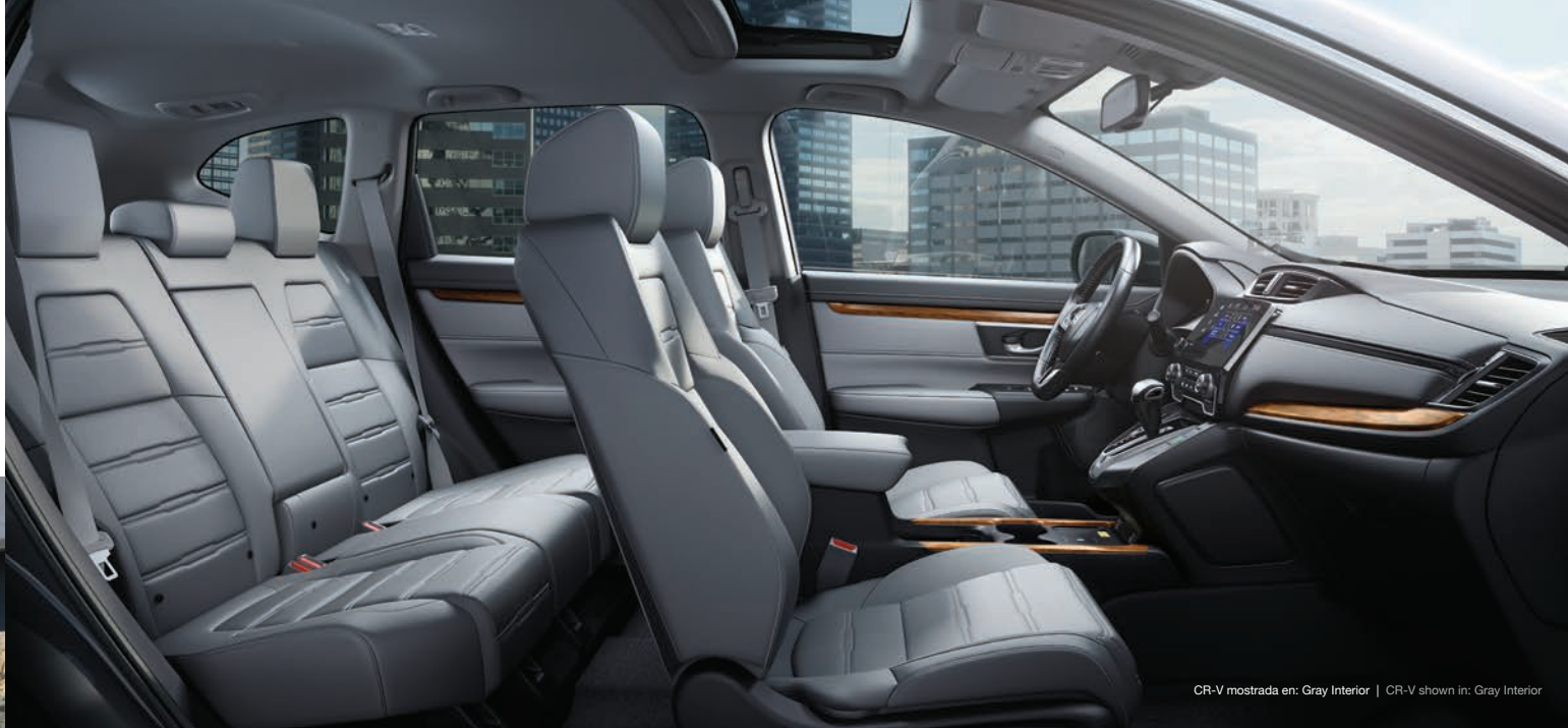
CR-V mostrada en: Gray Interior | CR-V shown in: Gray Interior

La rediseñada CR-V ofrece más comodidad y conveniencia que nunca, desde un interior de cuero hasta una puerta trasera eléctrica (EX-L). La filosofía de Honda es ofrecer siempre un mejor diseño. The redesigned CR-V delivers more comfort and convenience than ever, from an available leather-trimmed interior to a power tailgate (EX-L). Because design that enhances is the Honda way.