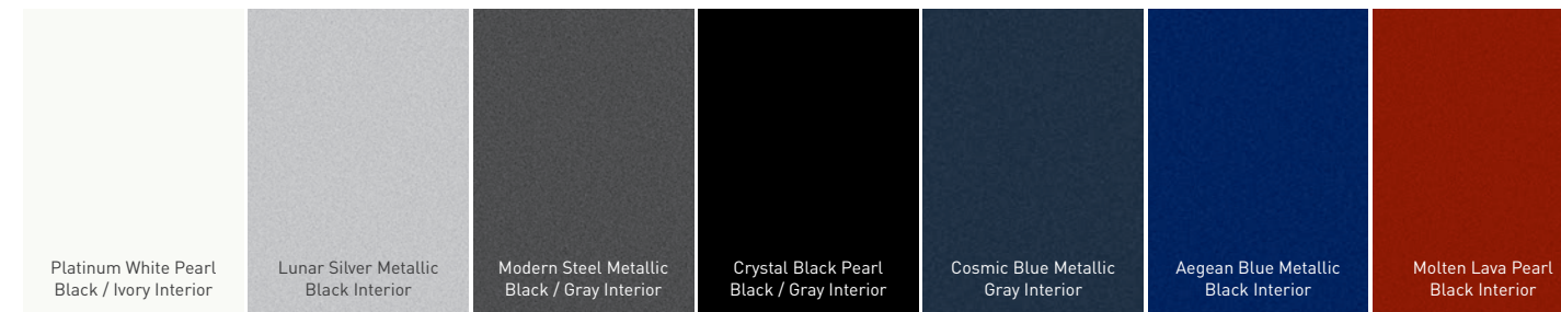
Molten Lava Pearl Black Interior