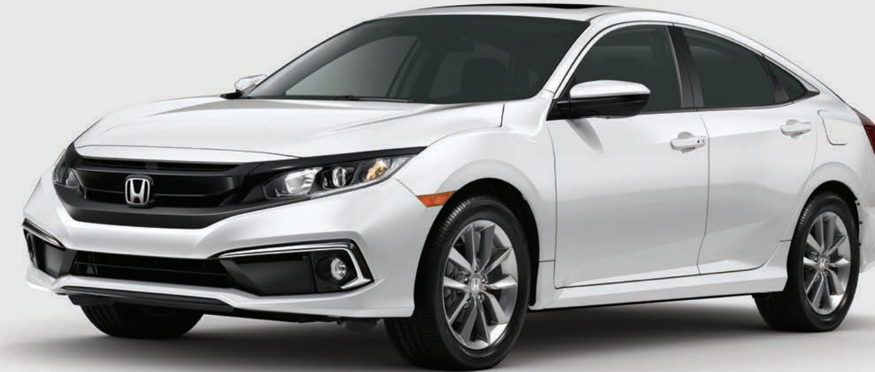
Civic Sedán mostrado en: Platinum White Pearl / Civic Sedan shown in: Platinum White Pearl