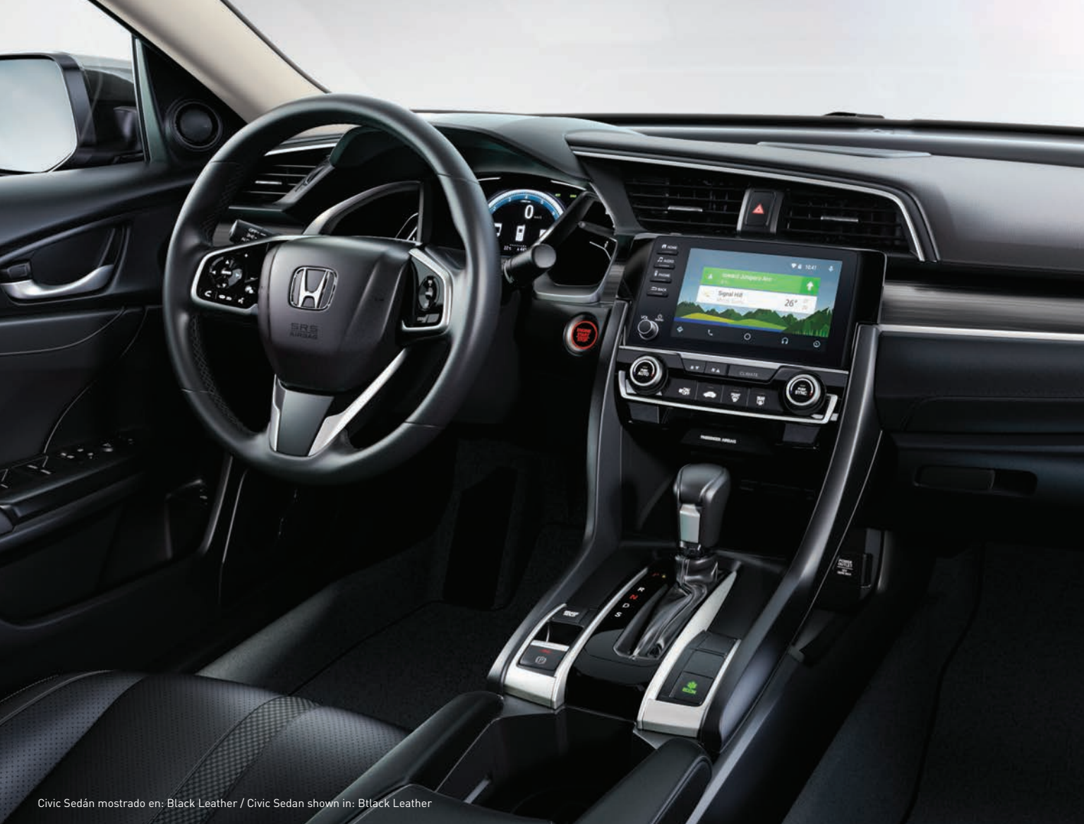
Civic Sedán mostrado en: Black Leather / Civic Sedan shown in: Black Leather